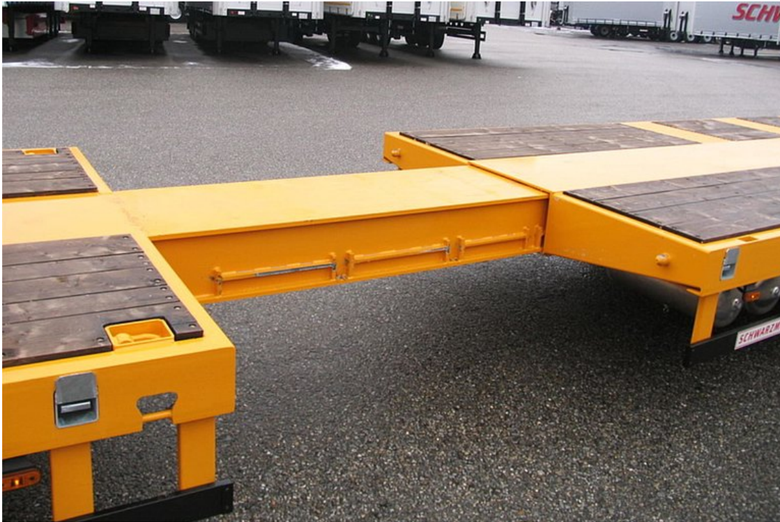
Roztahovatelný centrální rám, více možností nastavení délky, s pneumatickým zajištěním