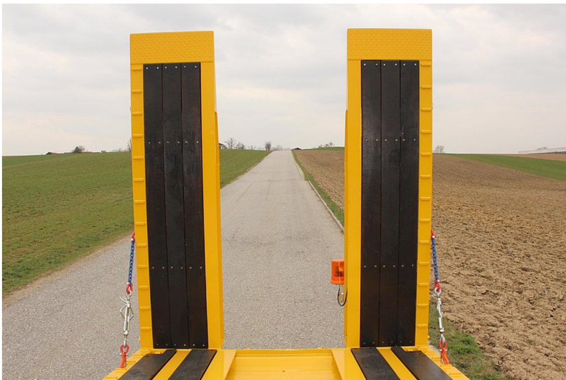
Nájezdové rampy s vyložením z tvrdého dřeva a navařenými čtyřhrany