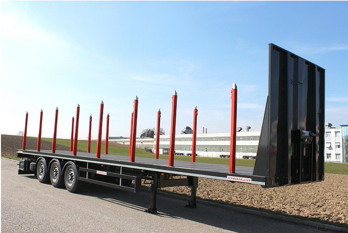
3-nápravový klanicový valníkovaný návěš