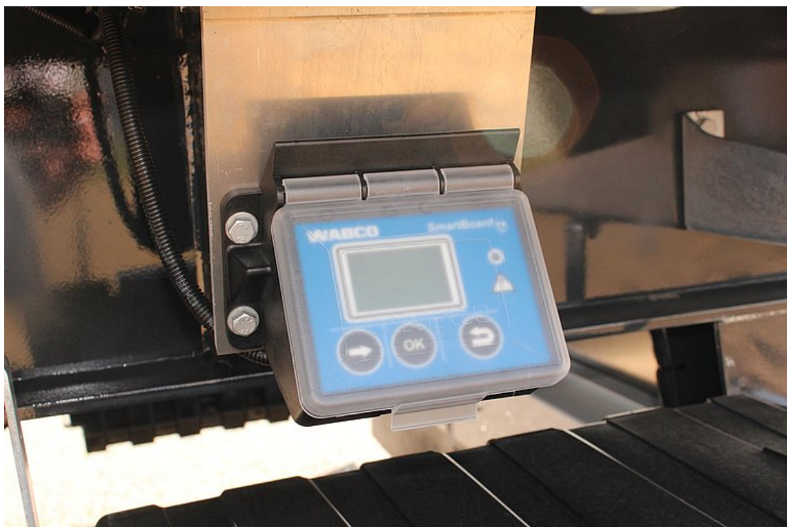
VOLITELNĚ: SmartBoard - zobrazovací a ovládací jednotka od firmy Wabco umístěná na vozidle= čtení údajů o provozu vozidla na displeji jednotky (stav km, zatížení náprav, atd.)