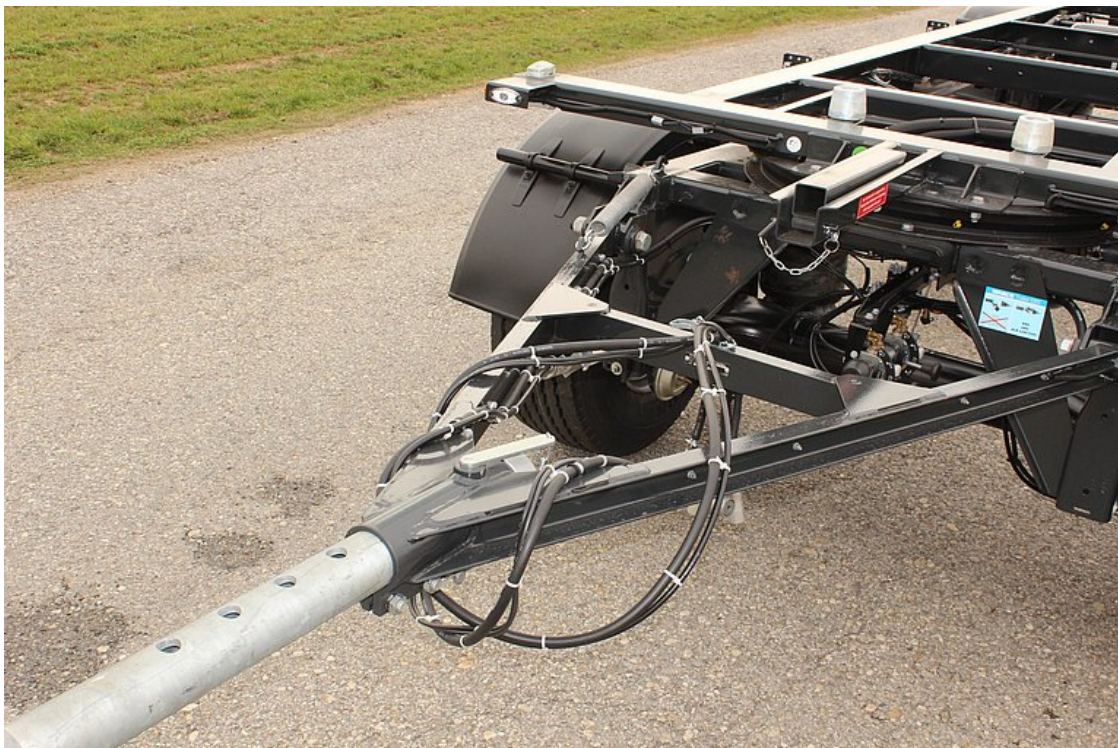
Výsuvná oj, max. 600 mm přestavitelná, s GETOFIX opěrou