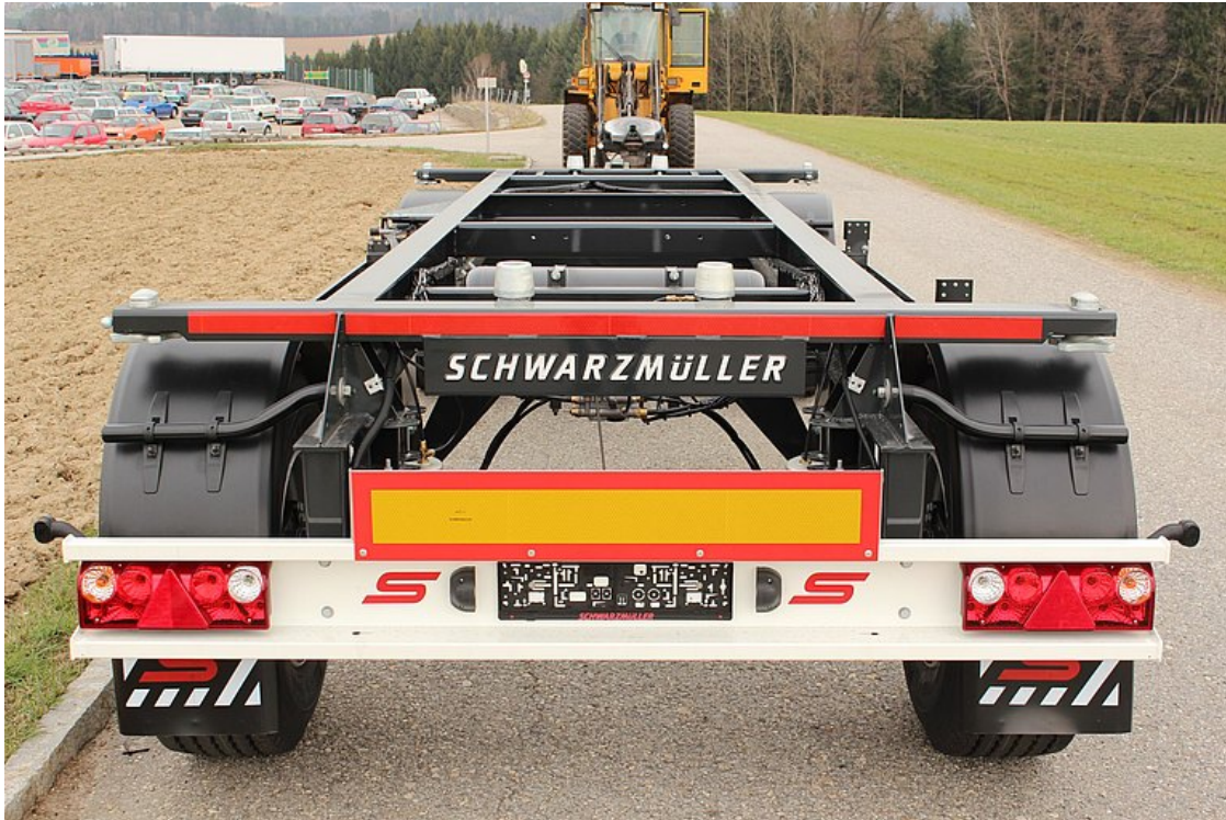
Nárazník s integrovanými světly