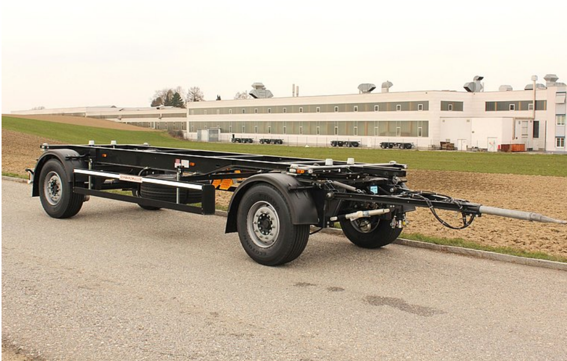
2-nápravový přívěs pro výměnné nástavby BDF