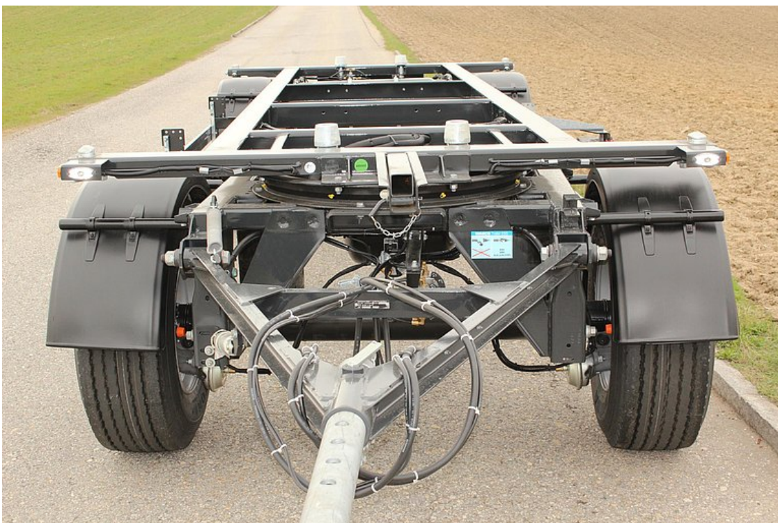
Otočný podvozek s předním výložníkem