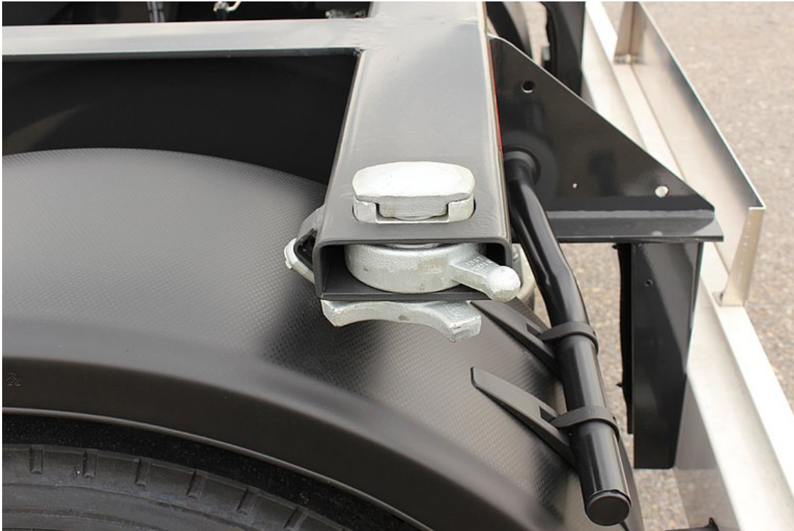
Výložníky vč. kontejnerového zámku dle EN 284