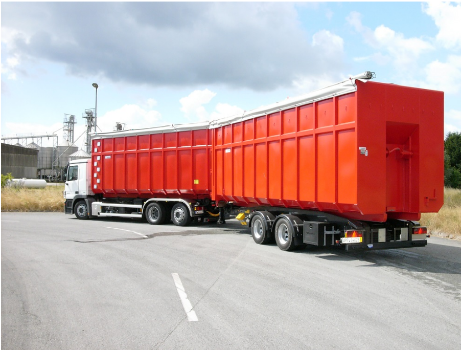
Celá souprava s optimálním objemovým vytižením