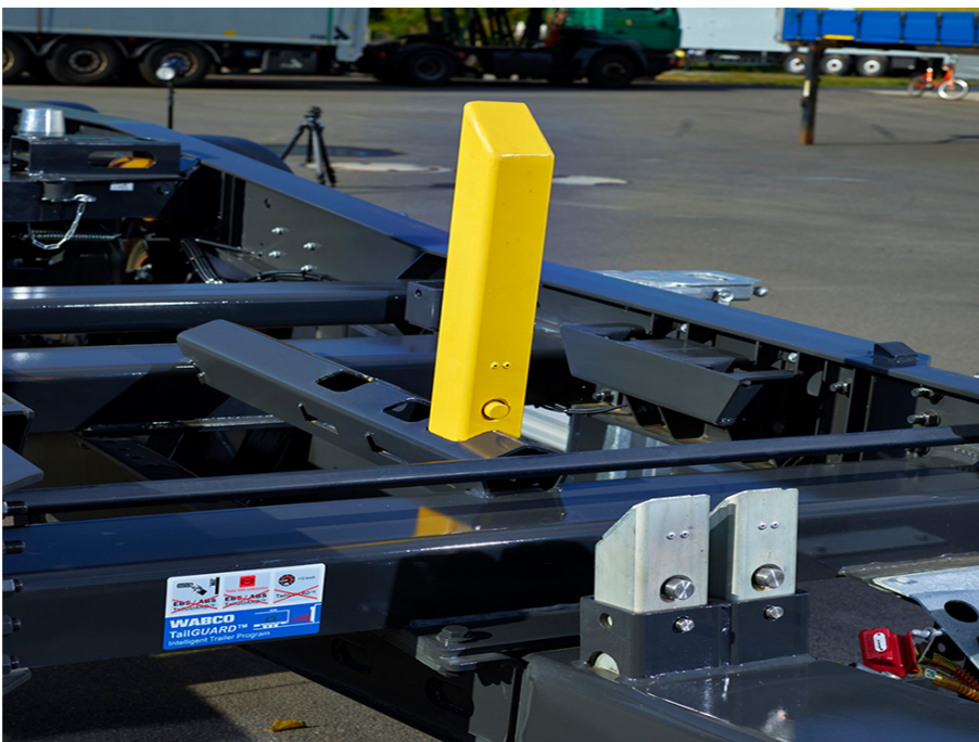
Detail zásuvného klínu