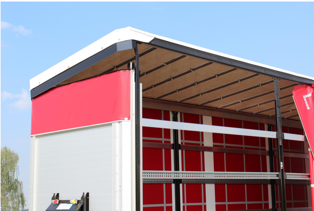
VOLITELNĚ: hydraulický Hubdach s manuálním ovládáním se zdvihem 400 mm, pro rychlou nakládku a vykládku