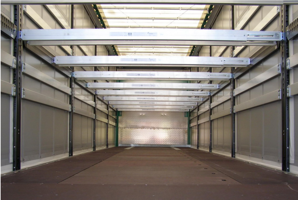
VOLITELNĚ: systém dvojité podlahy CTD III pro 11 x 3 Europalet, nosnost 400 kg/paletu