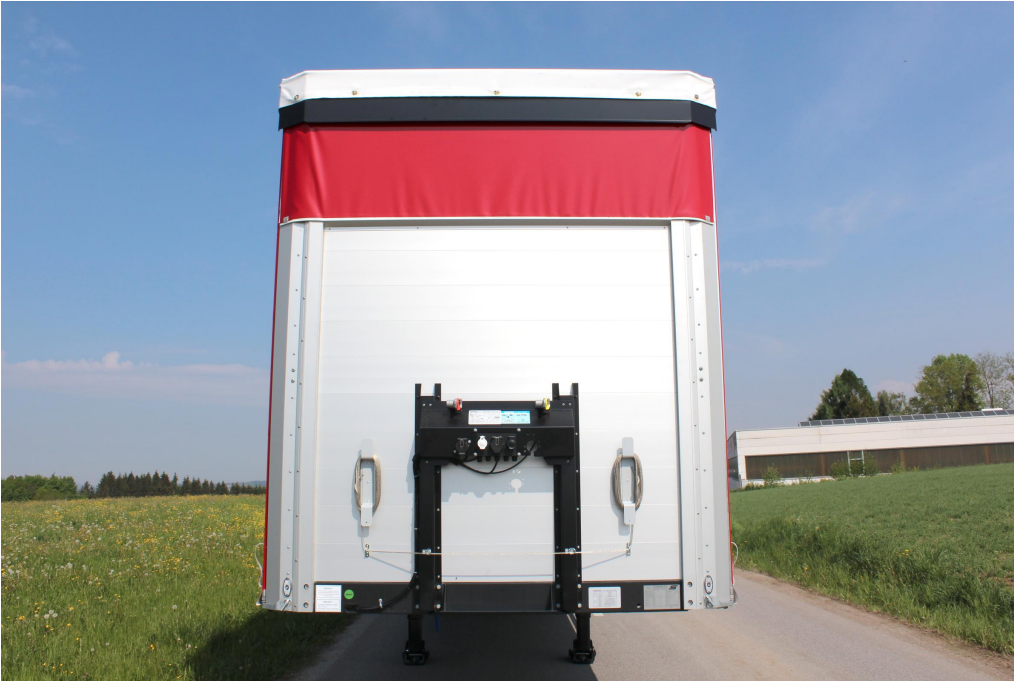
Zesílená přední stěna z hliníkových dutých profilů s integrovaným držákem napájecích přípojů