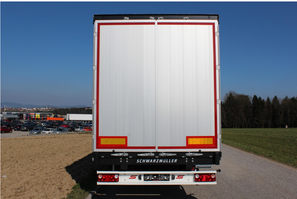
Vzadu našroubovaný portál s hliníkovými rohovými sloupky a s dvoukřídlými vraty přes celou vnitřní výšku