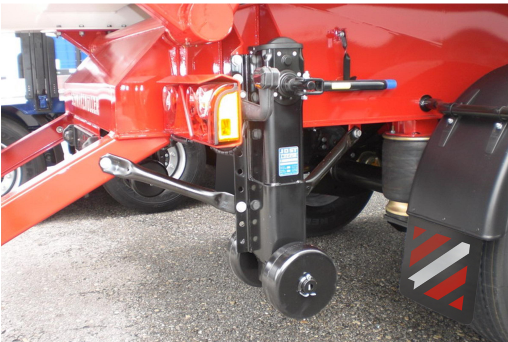
VOLITELNĚ: na konci rámu 2 výsuvné ocelové opěry s koly