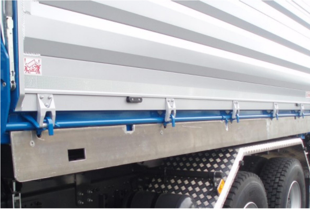
VOLITELNĚ: hliníková výsypná lišta na boční centrální uzavírací tyči