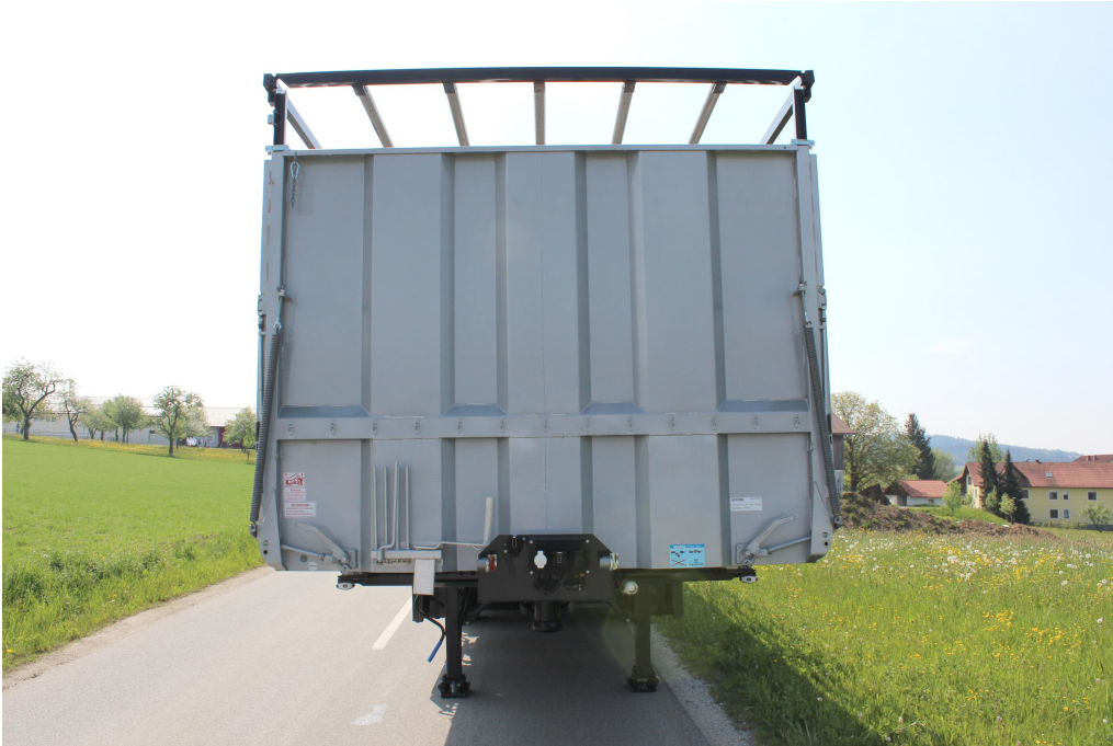
Pevná přední stěna z ocelového plechu tl. 3 mm