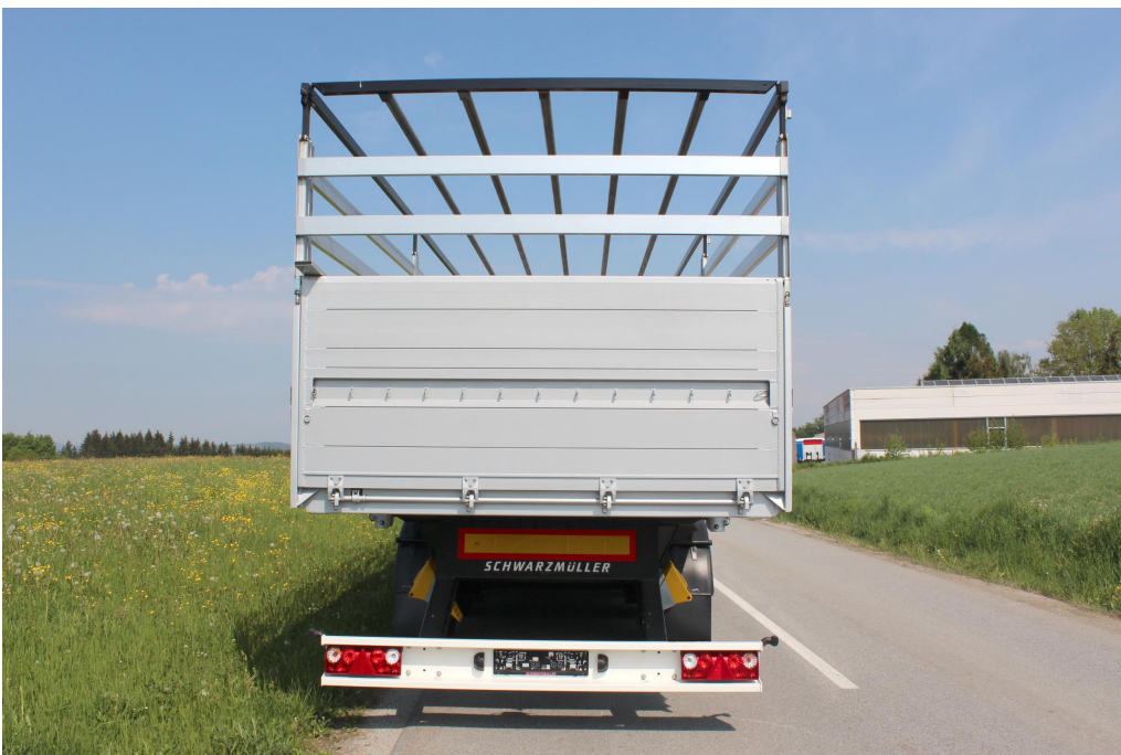
Zadní stěna z dutých hliníkových profilů, sklopná s prodlouženými uzávěry, rovněž výkyvná s dodatečným manuálním centrálním ovládáním