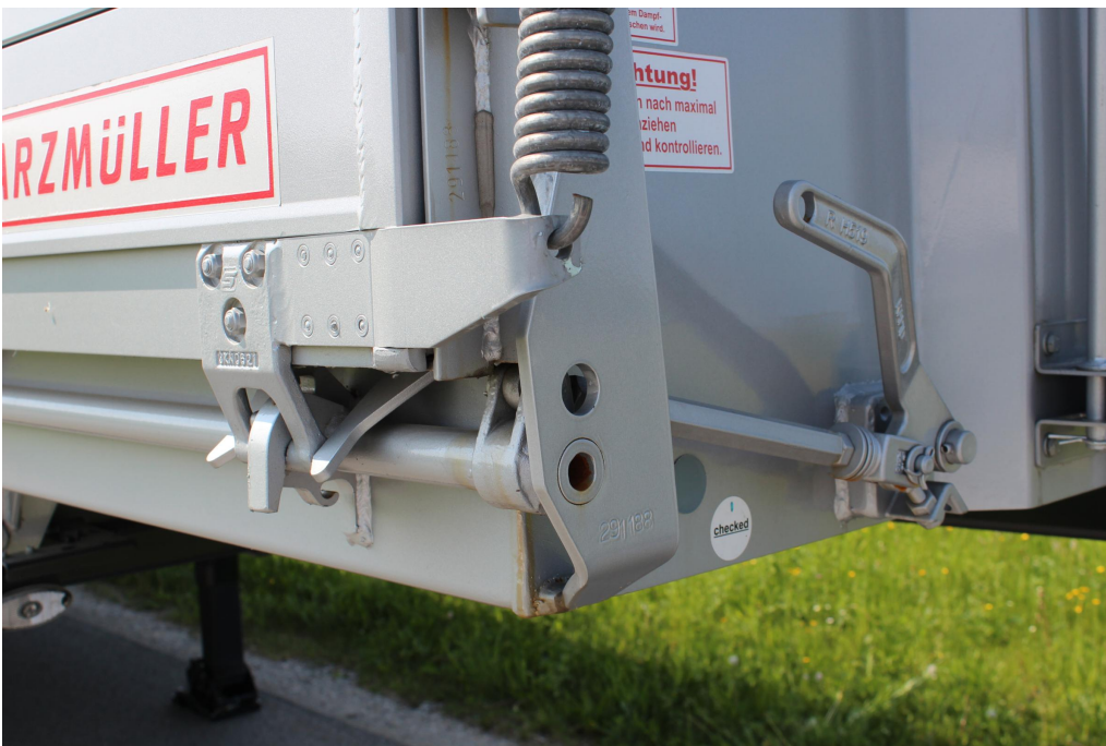
Manuální centrální ovládání k otevírání bočnic prostřednictvím páky a centrální uzavírací tyče