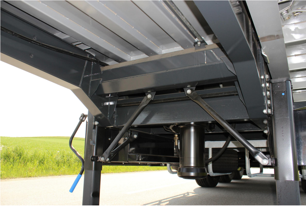
Stabilní a tuhá konstrukce podvozku s dodatečnými torzními profily pro třístranné sklápění