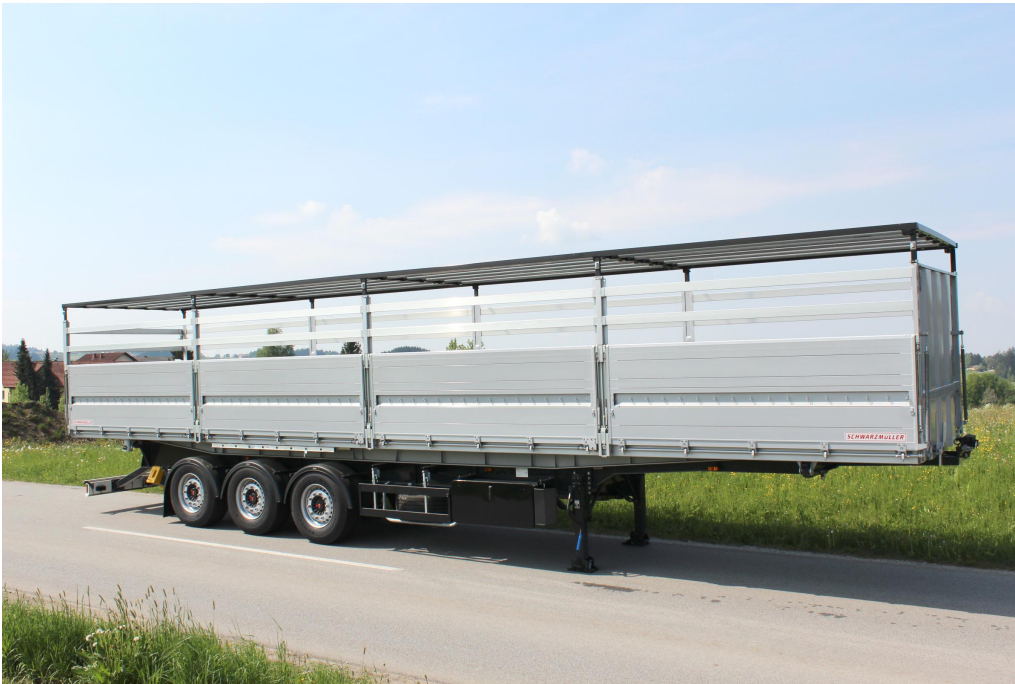
Třínápravový třístranný sklápěcí návěs - pro dálkovou přepravu