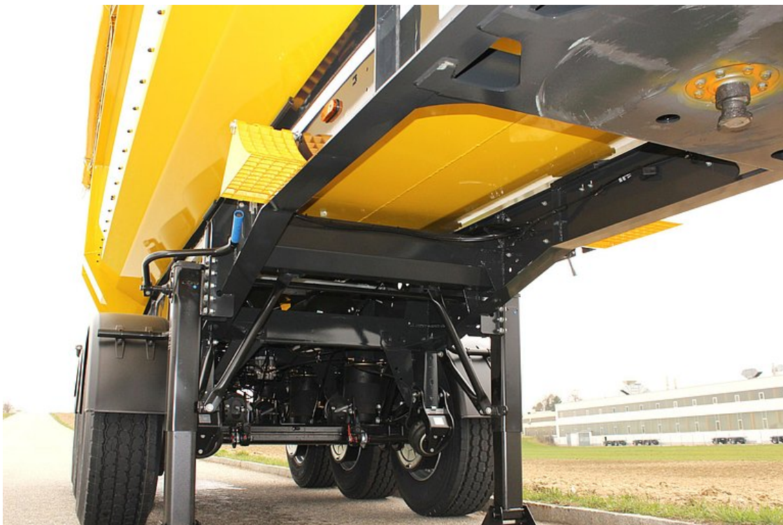
Stabilní a tuhá konstrukce podvozku s dodatečnými torzními profily