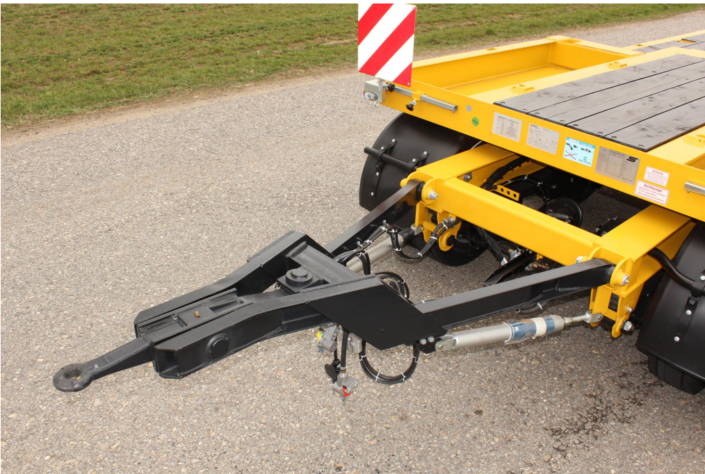
Zalomená tažná oj s vysokozátěžovým okem 40 + 50 mm