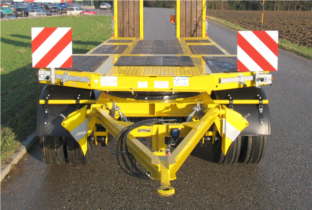
Vpředu točna vč. tažné oje a výsuvných varovných tabulí pro přepravu nadměrně širokých nákladů