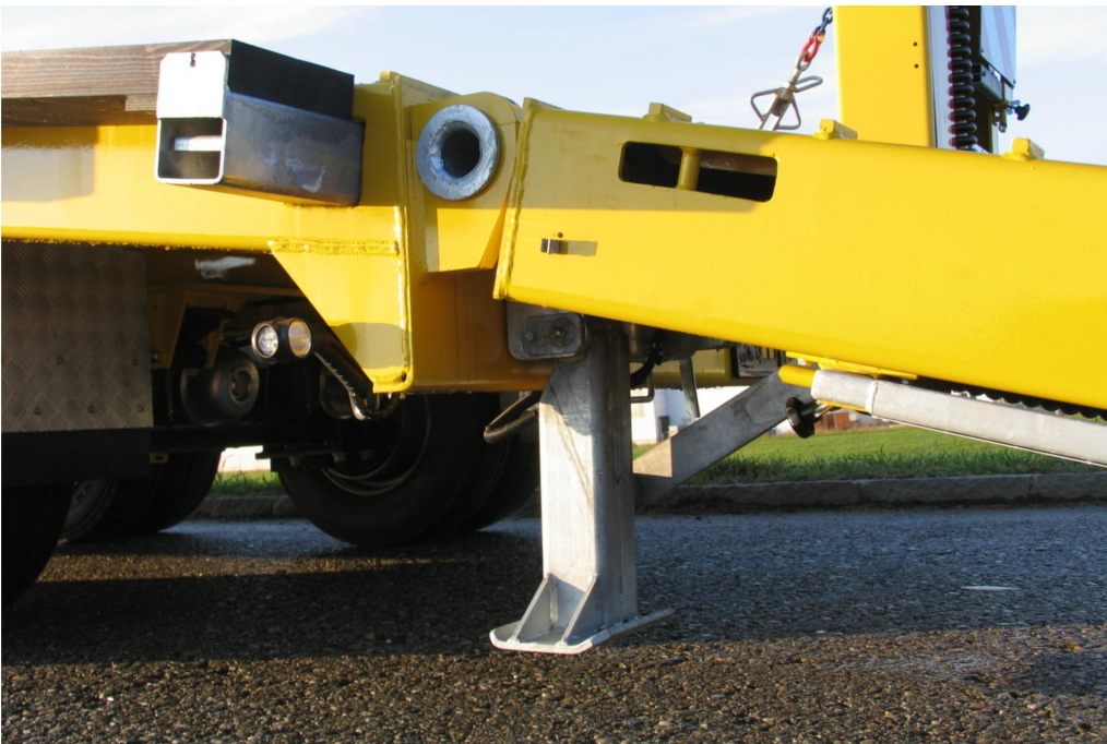
Vzadu na nájezdových rampách resp. na konci rámu automaticky sklopné opěry