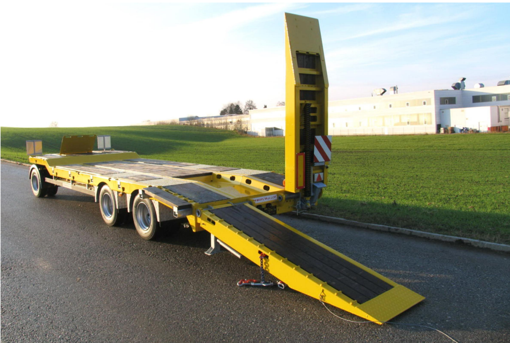
2 sklopné 1-dílné nájezdové rampy s vyložením z tvrdého dřeva