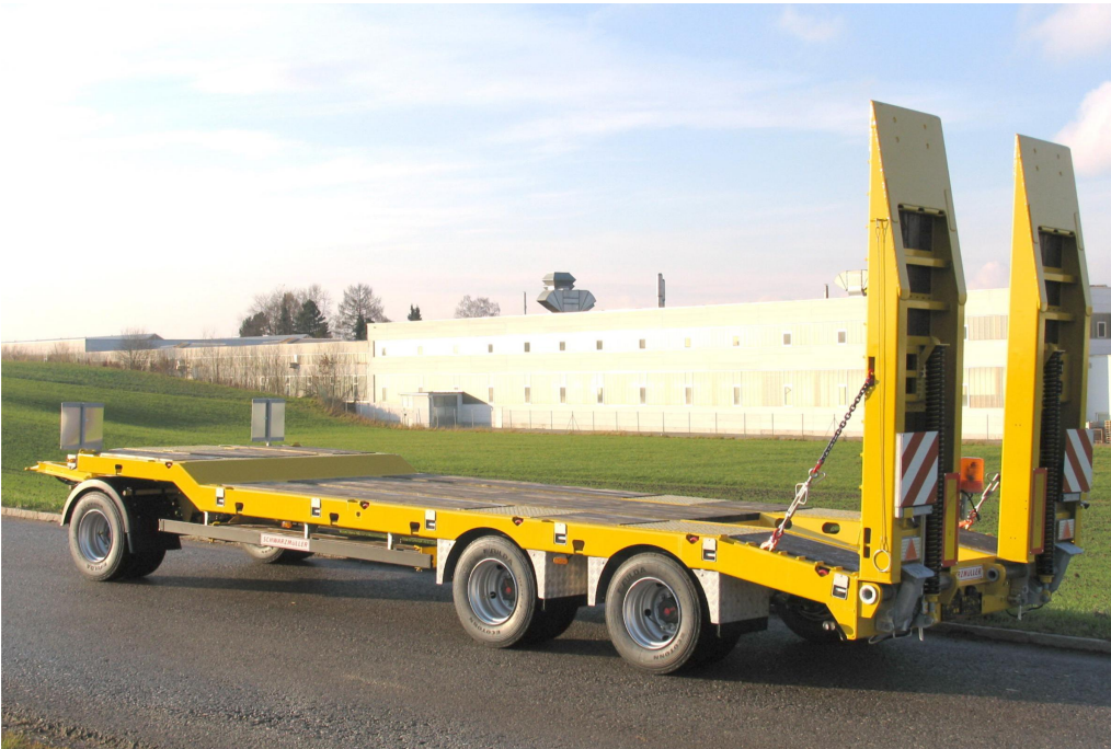
Třínápravový nízkoložný přívěs