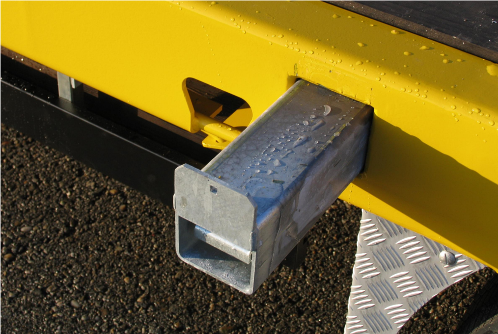
Výsuvné rozšíření vč. dřevěných fošen pro přepravu nadměrně širokých nákladů