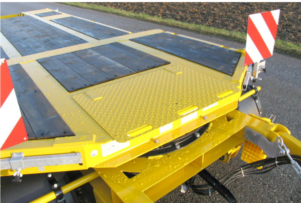
Přední zalomená plošina s úložnou schránkou vč. víka