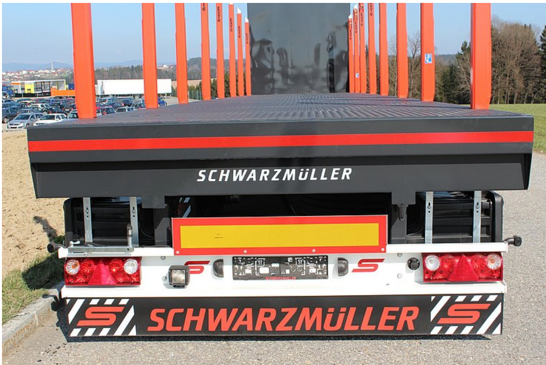
Zadní uzavírací plech vč. namontovaného hliníkového nárazníku