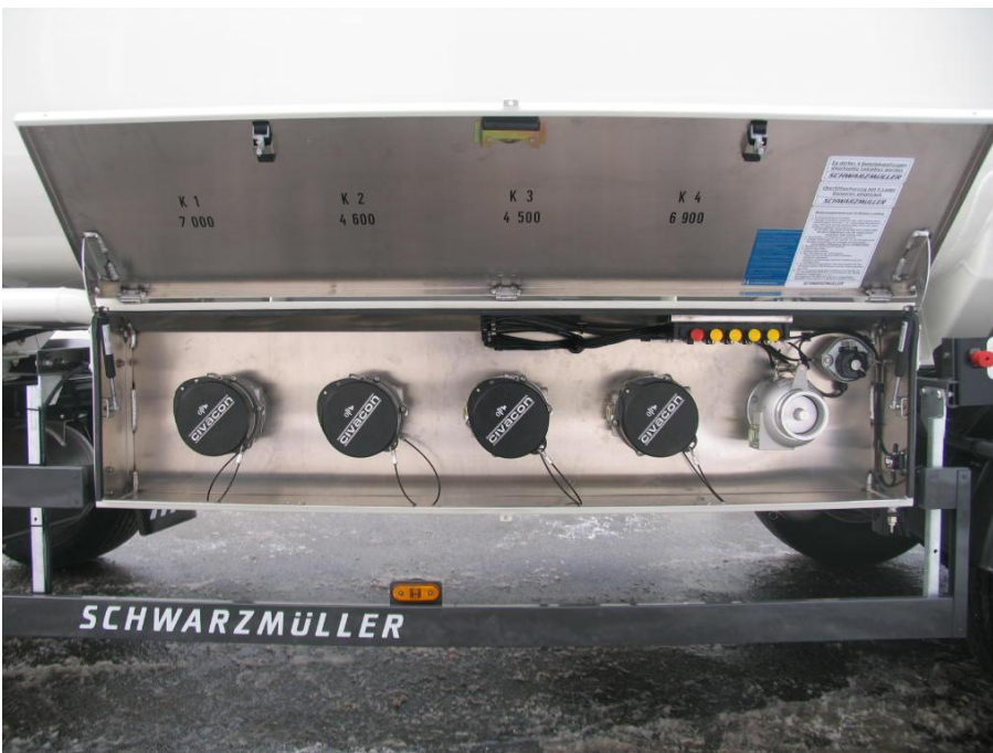
Přehledné uspořádání armatur pro efektivní a bezchybné ovládání